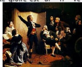
Rouget de Lisle chantant La Marseillaise Isidore Pils (1849)